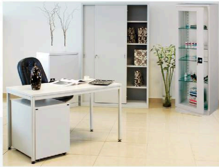
Biurko Bim 021