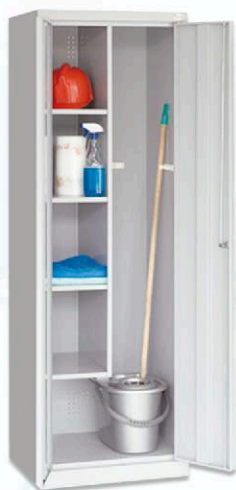
Szafa gospodarcza Smd 62

W drzwiach otwory wentylacyjne pozwalające na wymianę powietrza. Szafy Sum proponujemy w różnych wersjach cenowych - w zależności od grubości i rodzaju blach, z jakich są wykonane. Nóżki i wieńiec dolny ocynkowane - lepsza ochrona antykorozyjna szafki.