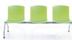
Step zestaw 3