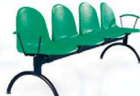
Amigo zestaw 4