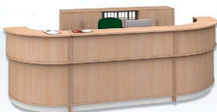
Lada do rejestracji "Perła"