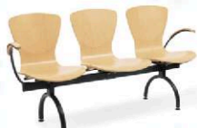
Bingo zestaw 3