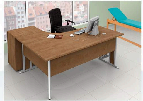
Biurko systemu "Hematyt"