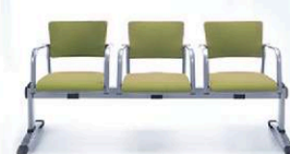
Kala zestaw 3

Wszystkie prezentowane krzesła i siedziska mogą być wykonane z materiałów zmywalnych.