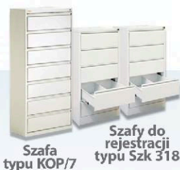
Szafa typu KOP/7

Nowe kierunki wyznaczone służbie zdrowia powodują wzrost oczekiwań wobec placówek medycznych. Wiarygodna i profesjonalna placówka służby zdrowia to wysoka jakość usług medycznych, najnowocześniejszy sprzęt, najlepsza kadra medyczna, a także nowoczesne wyposażenie wnętrza, które tworzą przyjazną pacjentowi atmosferę.