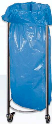
Wózek na odpady z wymiennym workiem plastikowym 100 l