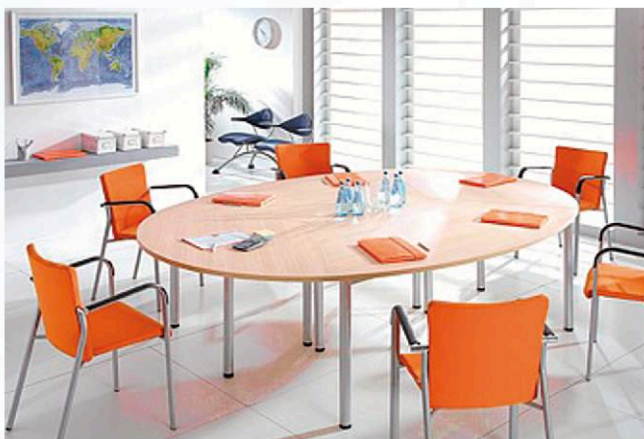
Stół do pomieszczeń socjalnych i sal konferencyjnych oraz krzesła Kala