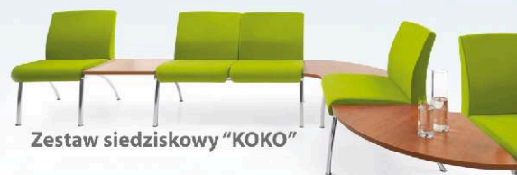
Zestaw siedziskowy "KOKO"