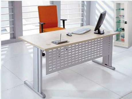
Biurko systemu "Top Office Bis"