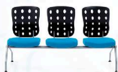
Uwu zestaw 3