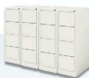
Szafy do rejestracji typu Szk 301