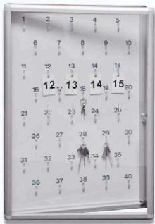
Gablota na klucze