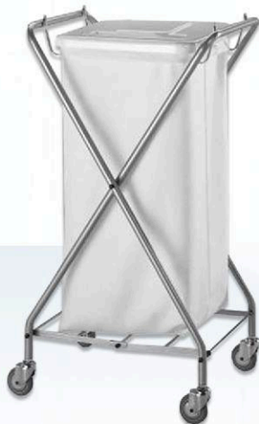
Wózek na brudną bieliznę z workiem tekstylnym 100 l